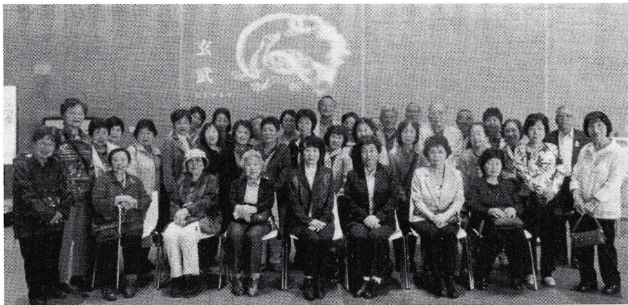
総会後にキトラ古墳を見学した出席者の皆さん

「この度会長として指任を頂きました。東瀬会長の御指導の下、後には会長はごも無理だ、婦連合会を続けるため